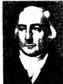
დევიდ პერგლი (1705-1757)

დევიდ პერგლი (1705-1757) არაა ისეთი მასშტაბის მოაზროვნე, როგორსაც მისი თანამედროვე და თანამემამულე ბერკლი ან პიუში წარმოადგენდნენ, მაგრამ მან უდავოდ უფრო დიდი როლი ითამაშა იმდროინდელ ფსიქოლოგიაში, ვინაიდან შექმნა პირველი, დასრულებული სახის ასოციაციონისტური სისტემა. მოსაზრება იმის თაობაზე, რომ მეხსიერებაში წარმოდგენათა შორის კავშირის დამყარების პროცესი ვარკვეულ კანონებს ემორჩილება, ჯერ კიდევ არის გოგელემ გამოთქვა. იდეებს შორის კავშირებზე (ასოციაციებზე) აგრეთვე შეუთითებდნენ სპინოზა, პიუში, ლოკი (გერმინი "ასოციაცია" სწორედ ლოკს ეკუთვნის). უფრო თამამად საუბრობდა ასოციაციის პრინციპზე ბერკლი, პიუშმა კი ის ფსიქიკური მსხარისების გაერთიანების ყველაზე გავრცელებულ