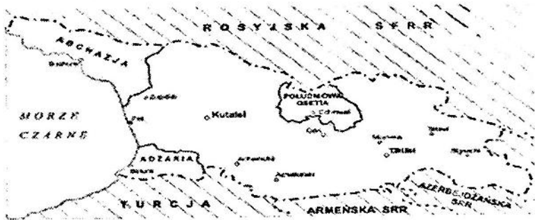
რუქა 3. საქართველოს სსრ

ტრანსპორტი დაიძრა სამხრეთისკენ და როცა ასტრახანში ჩავიდა, ბადრაგი გააძლიერეს, რის გამოც გათავისუფლების უკვე აღარავის სჯეროდა. აქ პოლონელებს მისცეს წყალი, ორცხობილა, თევზი და თითო-თითო კოვზი შაქარი. შემდგომ მატარებლის მარშრუტი, პატარ-პატარა გაჩერებებით, გამოიყურებოდა ამგვარად: კიზლარი, გუდერმესი, ხასავეურტი, მახაჩკალა, დერბენტი, ბაქო, კიროვაბადი, რუსთავი, თბილისი, გორი, ქუთაისი - რომელიც განლაგებულია კოლხეთის დაბლობზე 1 . მგზავრობას ერთ კვირაზე მეტი დრო დაჭირდა. 1945 წ. 20 ოქტომბერს ტრანსპორტი გაჩერდა სარკინიგზო სადგურზე. იქ პატიმრები გაამწყრივეს და ძლიერი გაძლიერებული ბადრაგით გადაიყვანეს გარდამავალ ქვებანაკში, რომელიც კარანტინის ფუნქციას ასრულებდა. ის 1945 წ. 30 ივლისის სსრკ შსსკ № 00911 ბრძანების საფუძველზე შედიოდა ქუთაისის საკონტროლო-ფილტრაციული ბანაკის (სფბ) № 0331 შემადგენლობაში 2 (იხ. რუქა N3).