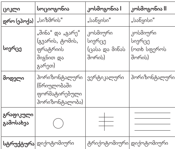
სქემა 1. დროისა და სივრცის კატეგორიები სოციოგონიასა და კოსმოგონიაში.

კნელი სამყაროს წყობის უნივერსალურ მოდელს ქმნის, სადაც ერთმანეთთან ჰორიზონტალურ მიმართებაში იმყოფება. „სამყაროს ვერტიკალური ღერძის ბოლოზე „სულეთის ქვეყანამ“ შედარებით გვიან გადაინაცვლა“ (ბახტინი 1965:26, სურგულაძე 1987:145). „მითიური დროიდან“ მითის „საწყის დროზე“ აპელირებამ სამყაროს სტრუქტურის ჰორიზონტალური განცდა, ტრიქოტომიული ვერტიკალურით შეცვალა. ეს ახლებურად გააზრებული, ახლებურად – კოსმიურად „გადალაგებული“ დრო-სივრცითი მოდუსებია, სადაც „მითიური დროის“ ხარჯზე „კოსმიური სივრცის“ მითოსური ხატი გამოიკვეთება (იხ. სქემა 1.).