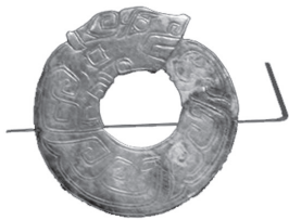
ძვ. ჩინური „კუდისმჭამელი“ დრაკონი. შანის ეპოქა

აღბათ, რომ არა ამ ღვთაებათა ნაწილობრივი ანთროპომორფიზაცია, ეს წყვილი წარმოგვიდგებოდა მთელი სხე-