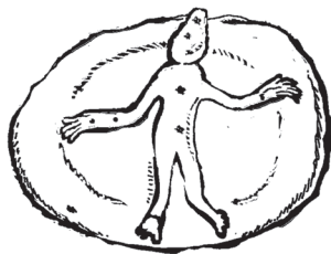
ბასილა – რიტუალური კვერი

ასევე ეპითეტისა და ზედწოდების დონეზე შეიძლება დავადასტუროთ ქართული კოსმოგონიური მითოსის კვალი ერთ-