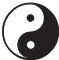
ჩინური ინი და იანი

ფიკულად სტილიზებულ ვარიაციას: ურთიერთგადაჯაჭვულ, წრეშეკრულ, ნათელ და ბნელ ფერებში შესრულებულ სტილიზებულ ორ გველს (წრიული თავით, რომელშიც ჩასმულია წერტილი-თვალი, ხოლო თავის ქვემოთ ფიგურის თანდათანობითი შევიწროება საბოლოოდ გველის კუდის ფორმას იღებს).