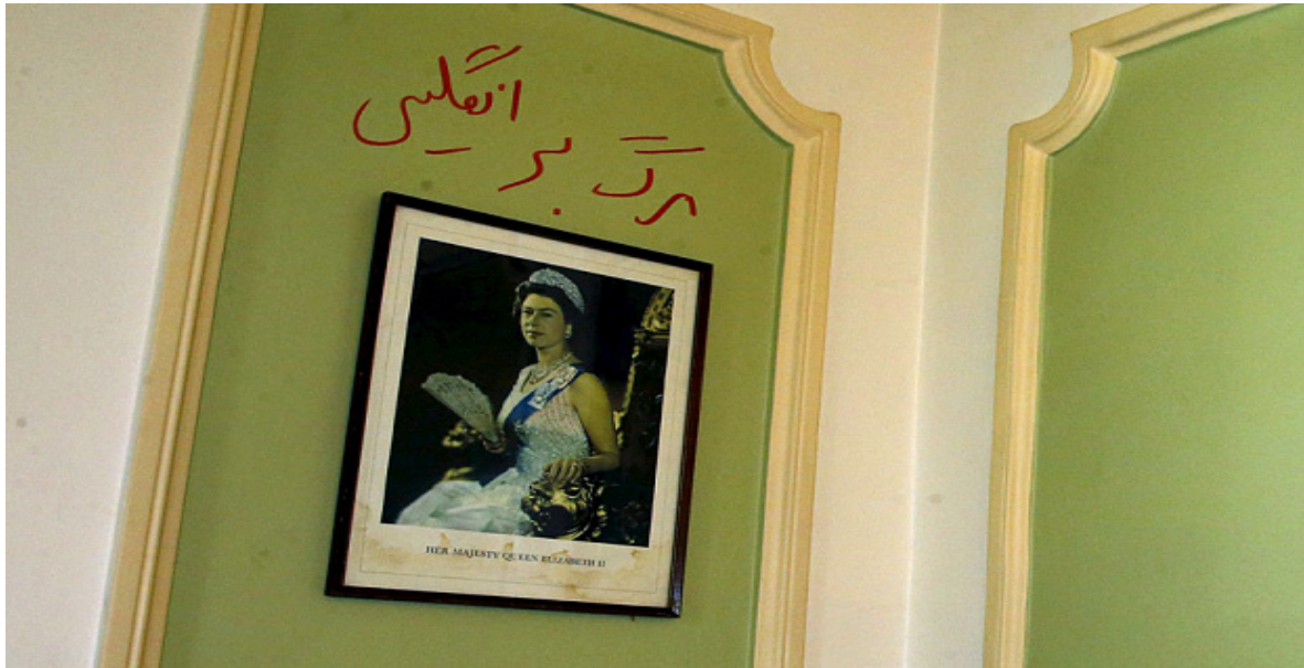
თეირანში დიდი ბრიტანეთის საელჩოს ერთ-ერთ კედელი - სურათის ზემოთ სპარსული წარწერა „სიკვდილი ინგლისს“.

კედლებზე რადიკალური სტუდენტების გაკეთებული წარწერა სპარსულად „სიკვდილი ინგლისს“ ისევ „ამშვენებს“ დედოფალ ელიზაბეტის სურათს: