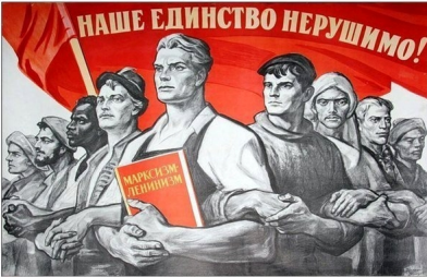
Марксизм непримирим с национализмом, будь он самый "справедливый", "чистенький", тонкий и цивилизованный. Марксизм выдвигает на место всякого национализма — интернационализм. В.И. Ленин

წავლო გეგმები და სასწავლო კურსების შინაარსი. მათ საფუძვლად ედო მარქსისტულ-ლენინური ინტერპრეტაცია არა მარტო საზოგადოებათმცოდნეობითი კურსებისა, არამედ საბუნებისმეტყველო საგნებისაც.