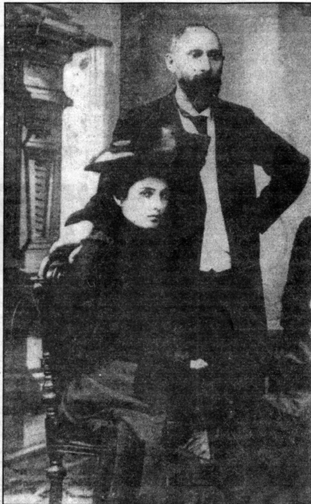
ექვთიმე თაყაიშვილმა, მიუხედავად მძიმე და რთული ცხოვრებისა, მიუხედავად ვაჭირებისა, მხოლოდ უპატრონა მისთვის მინდობილ საუნჯეს და უკვე ღრმად მოხუცი ამ საგანძურთან ერთად 1945 წლის 11 აპრილს თბილისში დაბრუნდა.

საფრანგეთში საქართველოს განძის ჩატანის ამბავი ფართოდ გახმაურდა და მისი შეძენის მეგობრები მსურველიც გამოჩნდა. ნიუ-იორკისა და ბრიტანეთის მუზეუმები ცდილობდნენ ხელში ჩაეგდოთ განძის თუნდ მცირე ნაწილი. ფრანგი ისტორიკოსი