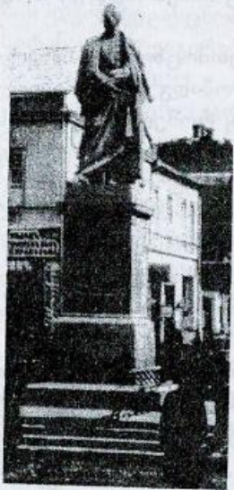
მ.ვორონცოვის ძეგლი თბილისში

ცოვს დიდების შარავანდედი შესძინა. მისი სახელი ფართოდ მოეფინა რუსული და ევროპული უურნალ-გაზეთების ფურცლებს. განსაკუთრებული დამსახურებისათვის იმპერატორმა ვორონცოვს თავადის ნოდება უბოძა.