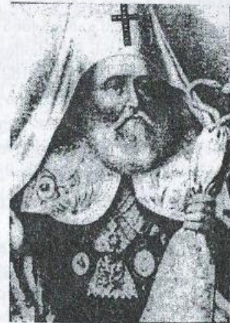
კათალიკოსი ანტონ II

საქართველოს ეკლესიის რეორგანიზაციის ახალი ეტაპი 1811 წლიდან დაიწყო. მთავარმართებელმა ტორმასოვმა დაარწმუნა