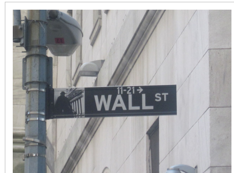
უოლ-სტრიტი ამერიკის საფინანსო ცენტრი