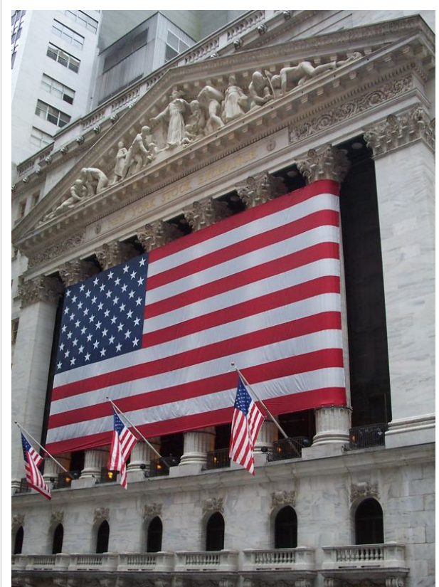
ნიუ-იორკის სააქციო ბირჟა (ინგ. The New York Stock Exchange - NYSE), მეტ-სახელით "დიდი დაფა", ფინანსური სამყაროსა და კერძოდ აშშ ფინანსური სიძლიერის სიმბოლო.

ფინანსების მართვას (ზოგადად) და შეიძლება ითქვას მართვის ხელოვნებას, სწავლობს მეცნიერება - ფინანსური მენეჯმენტი . საბანკო ფინანსების მართვა შეისწავლება საბანკო საქმის მეცნიერების ფარგლებში. ფინანსურ ბაზრებს სწავლობს მეცნიერება, რომელსაც ეწოდება ფინანსური ეკონომიკა . სტატისტიკის მცირე, თანამოსახელე ნაწილი შეისწავლის ფინანსურ სტატისტიკას . ფინანსური ინფორმაციის დამუშავების მეთოდებს შეისწავლის გამოყენებითი მათემატიკის მეცნიერება. ფინანსური ნაკადების კონტროლი შეისწავლება ფინანსური კონტროლის დისციპლინის ფარგლებში.