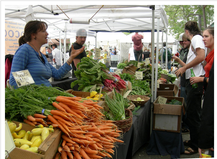
ტრადიციული ბაზარი ფიზიკური არენაა, სადაც გამყიდველები და მყიდველები ხვდებიან ერთმანეთს, ვაჭრობის საგნები გამოფენილია და მათზე გარიგებები ხდება.