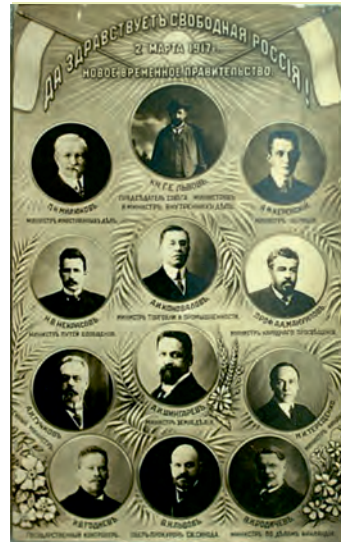
რუსეთის დროებითი მთავრობა შეიქმნა 1917 წ.-ის მარტში რუსეთის იმპერიის აღსასრულის შემდეგ. დროებითი მთავრობა რუსეთს განაგებდა 1917 წ.-ის მარტიდან ოქტომბრამდე.

რუსეთის ნაწილად აღიქმებოდა. თუმცა იყო ერთი მეტად მნიშვნელოვანი ფაქტორი: რუსეთის კავკასიის არმია, რომელიც კავკასიაში 1914 წლიდან იდგა, საბჭოთა რუსეთის მთავრობას არ ცნობდა, მის განკარგულებებს არ ასრულებდა და რეგიონს ოსმალეთის აგრესიისაგან იცავდა.