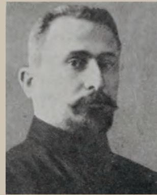
შალვა ელიავა –

დაიბადა 1885 წელს. რუსეთის სოციალ-დემოკრატიული მუშათა პარტიის წევრი გახდა 1904 წ. ბოლშევიკი, 1921 წლის თებერვალ-მარტში მონაწილეობდა საბჭოთა რუსეთის მე-11 არმიის მიერ საქართველოს დემოკრატიული რესპუბლიკის დაპყრობაში, საქართველოს რევოლუციური კომიტეტის წევრი, მუშაობდა უმნიშვნელოვანეს პარტიულ და სახელმწიფო თანამდებობებზე, იყო საბჭოთა საქართველოს სამხედრო და საზღვაო საქმეთა სახალხო კომისარი (მინისტრი), დახვრიტეს 1937 წელს.