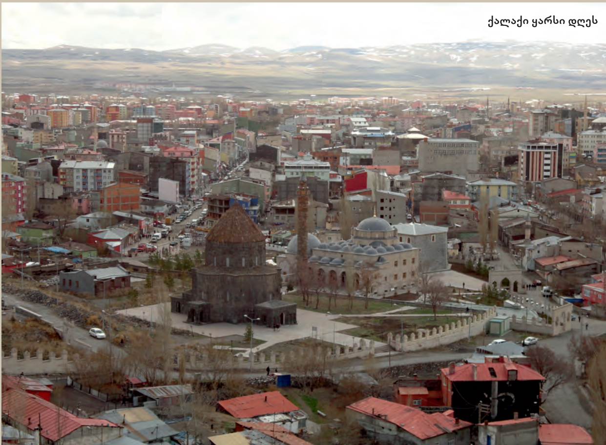
ქალაქი ყარსი დღეს

ყარსის ხელშეკრულების პირველი მუხლი ძალადაკარგულად აცხადებდა ყველა იმ ხელშეკრულებას, რომელიც ამიერკავკასიას (სამხრეთ კავკასიას) ეხებოდა. ეს არ ეხებოდა საბჭოთა რუსეთ-ოსმალეთის 1921 წლის 16 მარტის მოსკოვის ხელშეკრულებას. მეორე მუხლში აღნიშნული იყო, რომ საქართველოს, სომხეთსა და აზერბაიჯანს არ უნდა ეცნოთ არც ერთი ხელშეკრულება, რომელიც ეხებოდა ოსმალეთს, მაგრამ რომელთაც არ ცნობდა ოსმალეთის მთავრობა და ოსმალეთის დიდი ეროვნული კრება. თავის მხრივ, ოსმალეთი ვალდებულებას იღებდა, არ ეცნო