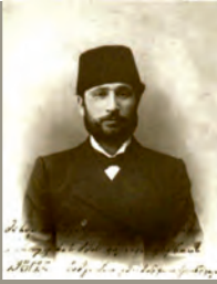
მემეიდ იზრაჰიშვილის ქა აზაშიძე

მემეიდ-ბეგი (1873-1937) – ქართველი საზოგადო მოღვაწე, მწერალი, პუბლიცისტი. სტალინური რეპრესიების მსხვერპლი. აქტიურად იბრძოდა მუსლიმან ქართველთა ეროვნული თვითშეგნების ამაღლებისა და საქართველოს ერთიანობისათვის, რის გამოც რამდენიმეჯერ დააპატიმრეს და გადაასახლეს.