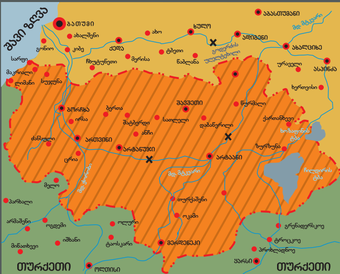
ბათუმის ოლქის სამხრეთი სექტორი, ართვინისა და არტაანის ოლქები 1921 წლის მარტისათვის

1801-1810 წლებში რუსეთმა ქართლ-კახეთის სამეფო, იმერეთის სამეფო, სამეგრელოს, გურიისა და აფხაზეთის სამთავროები დაიპყრო. საქართველოში ფეხის მოკიდების შემდეგ რუსეთმა ორგზის დაამარცხა ირანი (სპარსეთი), 1804-1813 და 1826-1828 წლების ომებში, და ორგზის დაამარცხა ოსმალეთიც (თურქეთი) – 1806-1812 და 1828-1829 წლების ომებში, ბუქარესტის (1812 წ.), გულისტანის (1813 წ. თურქმანჩაის (1828 წ.) და ადრიანოპოლის ზავებით რუსეთმა ირანსა და ოსმალეთს საქართველოს ისტორიული ტერიტორია (ჭარ-ბელაქანი, აფხაზეთი, სამცხე-საათაბაგო), აზერბაიჯანი და სომხეთი დაათმობინა.