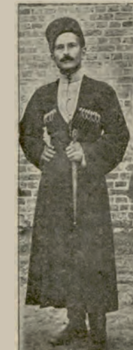
ალქასანდრა სვანიძე –

დაიბადა 1886 წელს, 1901 წელს შევიდა რუსეთის სოციალ-დემოკრატიულ მუშათა პარტიაში, ბოლშევიკი, 1919 წელს დატოვა საქართველო, 1920-1921 წლებში მუშაობდა საბჭოთა რუსეთის საგარეო საქმეთა სახალხო კომისარიატში, 1921 წელს დაინიშნა საბჭოთა საქართველოს საგარეო საქმეთა და ფინანსთა სახალხო კომისარად, 1935 წელს დაინიშნა საბჭოთა კავშირის სახელმწიფო ბანკის თავმჯდომარედ, იყო სტალინის პირველი ცოლის ძმა, თუმცა ამან ვერ უშველა, ნაცისტური გერმანიის სასარგებლოდ ჯაშუშობის ბრალდებით დააპატიმრეს და 1941 წ. დახვრიტეს.