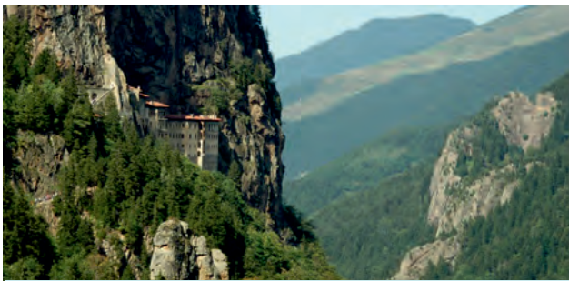
ანატოლია – ოსმალეთის პროვინცია ქვეყნის ალმოსავლეთ ნაწილში. ანატოლია იყოფა ორად: ალმოსავლეთ და სამხრეთ ანატოლიად.

ველო ფრონტისპირა რეგიონად იქცა. 1914-1915 წლებში ოსმალეთის არმიის ცდები – დაეკავებინა თბილისი და ბათუმი – რუსეთის კავკასიის არმიამ წარმატებით აღკვეთა, ხოლო შემდეგ საკუთრივ ოსმალეთის ტერიტორიის ნაწილი – ალმოსავლეთი ანატოლია – დაიკავა.