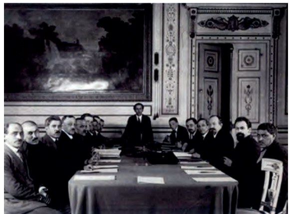
ამიერკავკასიის კომისარიატი შეიქმნა 1917 წ. 15 ნოემბერს. იგი წარმოადგენდა ამიერკავკასიის (საქართველოს, სომხეთის, აზერბაიჯანის) სამხარეო ხელისუფლების ორგანოს, რომელიც არ ცნობდა და ემიჯნებოდა საბჭოთა რუსეთს.

უმძიმეს მდგომარეობაში ჩავარდნილ საბჭოთა რუსეთს მსოფლიო ომის გაგრძელება აღარ შეეძლო. ვლ. ლენინი ხელისუფლების დაკარგვის რეალური საფრთხის წინაშე იდგა. ასეთ ვითარებაში საბჭოთა რუსეთმა გადაწყვიტა გერმანიასა და მის მოკავშირეებთან (ავსტრია-უნგრეთთან, ოსმალეთთან და ბულგარეთთან) სეპარატული ზავი დაედო. ზავს 1918 წლის 3 მარტს ბრესტ-ლიტოვსკში მოეწერა ხელი. ზავის სანაცვლოდ საბჭოთა რუსეთმა დიდი ტერიტორია დათმო. ეს შეეხო სამხრეთ კავკასიასაც. ბრესტ-ლიტოვსკის ზავის მეოთხე მუხლში აღნიშნული იყო: „არტა-