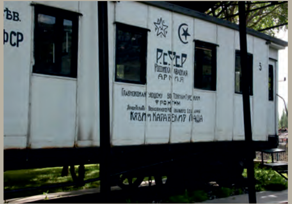
ვაგონი, რომლითაც საქართველოს, სომხეთისა და აზერბაიჯანის დელეგაციები ყარსის მოლაპარაკებაზე ჩავიდნენ

საქართველოს დემოკრატიული რესპუბლიკის დელეგაცია მოსკოვის მოლაპარაკებებში არ მონაწილეობდა. მიუხედავად ამისა, 1921 წლის 16 მარტის რუსეთ-ოსმალეთის მოსკოვის ხელშეკრულების პირველ მუხლში ოსმალეთის ჩრდილო-აღმოსავლეთ საზღვრის შესახებ აღნიშნული იყო: „ ოსმალეთის ჩრდილო-აღმოსავლეთ საზღვარი გადის ხაზზე, რომელიც იწყება შავ ზღვაზე მდებარე სოფელ სარფთან, გაზდევს ქედის მთას, შავშეთის მთების წყალგამყოფს და კანი-დალის მთას, ხოლო შემდეგ ჩრდილოეთიდან მიუყვება არტაანისა და ყარსის ოკრუგების ადმინისტრაციულ საზღვარს. “ ეს იმას ნიშნავდა, რომ საქართველოს დემოკრატიული რესპუბლიკის მთავრობის თანხმობის გარეშე, რომელიც 1921 წლის 17 მარტის საღამომდე ბათუმში, ე. ი. ქვეყნის ტერიტორიაზე, იმყოფებოდა, რუსეთმა 1921 წლის 16 მარტის მოსკოვის ხელშეკრულებით საქართველოს ისტორიული ტერიტორიის ნაწილი ოსმალეთის ტერიტორიად აღიარა.