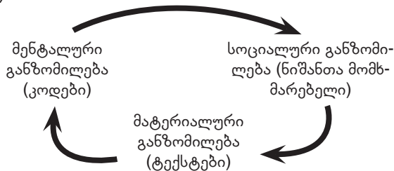
გრაფიკი 1. კულტურის სამგანზომილებიანი მოდელი (შდრ. Posner 1991, 54).

ნოიმანის და ნუნინგის მიხედვით, კულტურა მოიაზრება როგორც ადამიანების მიერ შექმნილი მთლიანი წარმოდგენების, ფიქრის და განცდების ფორმების, ღირებულებებისა და მნიშვნელობების მთელი კომპლექსი, რომელიც სიმბოლოთა სისტემაში აისახება (შდრ. Neumann/Nünning 2006, 18): კულტურის ამგვარი გაგება ეყრდნობა კულტურის მრავალგანზომილებიან მოდელს, რომლის მიხედვითაც იგი მატერიალურ, სოციალურ და მენტალურ განზომილებებს წარმოაჩენს (შდრ. Posner 1991, 54).