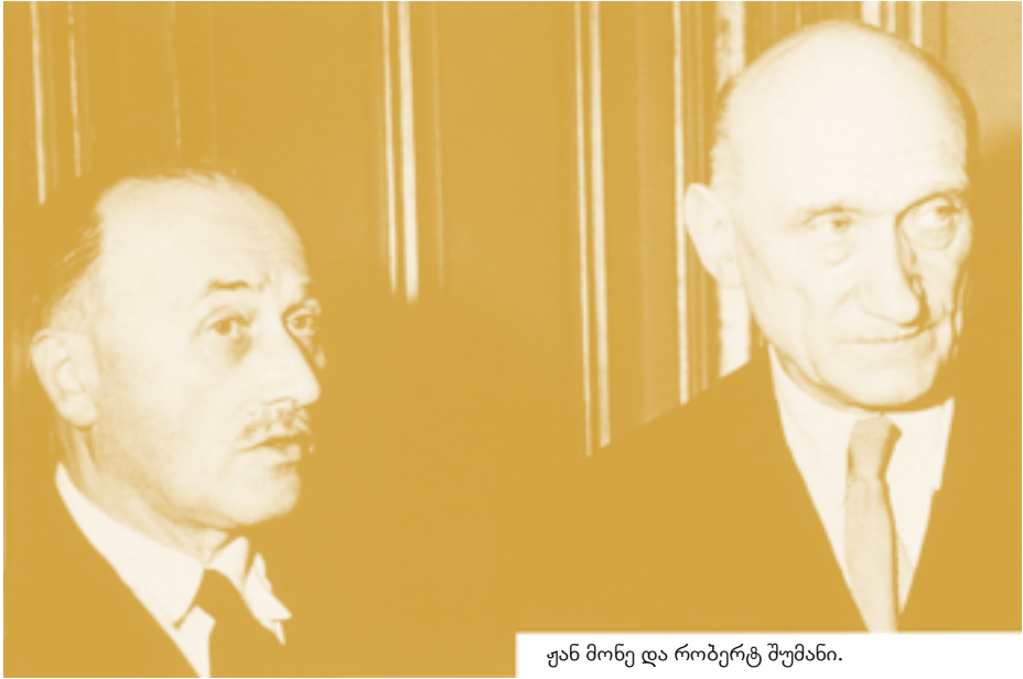
ჟან მონე და რობერტ შუმანი.