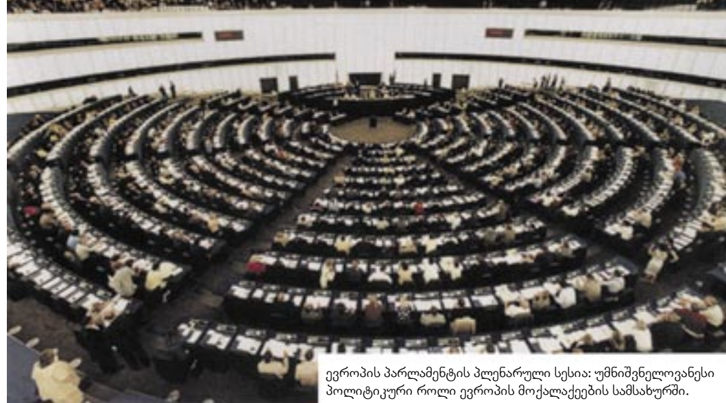
ევროპის პარლამენტის პლენარული სესია: უმნიშვნელოვანესი პოლიტიკური როლი ევროპის მოქალაქეების სამსახურში.

დემოგრაფიულ მდგომარეობასთან. ამიტომ 1999 წლის 11 დეკემბრის ჰელსინკის ევროპულმა საბჭომ გადაწყვიტა, მოენვია ახალი მთავრობათაშორისი კონფერენცია, რომელიც განსაზღვრავდა, თუ რა ცვლილებები უნდა შეტანილიყო ევროპულ ხელშეკრულებებში 2000 წლის დეკემბრისათვის. აღნიშნული კონფერენცია გაიმართება წლის პირველ ნახევარში პორტუგალიის თავმჯდომარეობით, ხოლო მეორე შეკრებას უხელმძღვანელებს საფრანგეთი. კონფერენციის მიზანია, განსაზღვროს ევროკომისიის მოცულობა, შეაფასოს ხმები მინისტრთა საბჭოში და იმ გადაწყვეტილებათა რაოდენობის შესაძლო ზრდა, რომლებიც შეიძლება მიიღოს კვალიფიცირებულმა უმრავლესობამ. შესაძლებელი იქნება სხვა რეფორმების გატარებაც, რომლებმაც, ალბათ, უნდა გაითვალისწინოს მექანიზმი იმისათვის, რომ გაზრდილ ევროკავშირს ძველებურად შეეძლოს ეფექტური გადანაცვლებების მიღება და მოქალაქეთა მოლოდინის დაკმაყოფილება. 1999 წლის ივნისის ევროპული არჩევნებისას მოქალაქეებმა გამოავლინეს უფრო დიდი გამჭვირვალების და ინსტიტუტებთან უფრო მჭიდრო თანამშრომლობის სურვილი. მათ გაუჩნდათ კითხვები: ვინ იღებს გადანაცვლებებს კავშირში? როგორ ხდება გადაწყვეტილებათა მიღება? როგორ შეუძლია საზოგადოებას თანამეგობრობის ბიუჯეტში ჩარიცხული ფულადი სახსრების