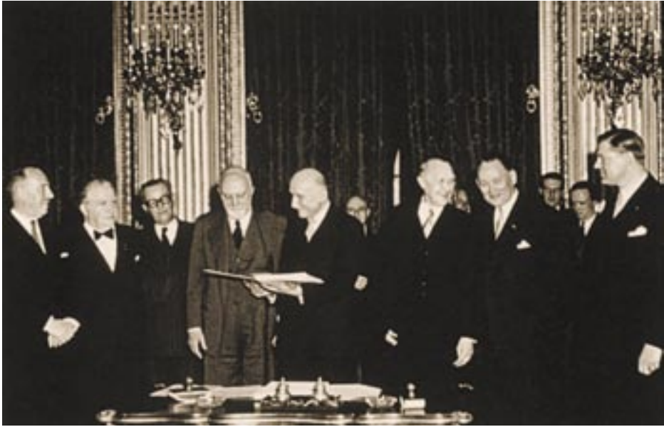
1951 წლის 18 აპრილს ხელი მოეწერა პარიზის ხელშეკრულებას; ეს იყო პირველი ხელშეკრულება, რომლის საფუძველზეც დაარსდა ევროპული თანამეგობრობა.

ორგანიზაცია ამ უკანასკნელის მიზნებისა და მეთოდების გათვალისწინებით. დაარსების პროცესში მყოფი ორგანიზაციისთვის ძალიან მნიშვნელოვანი იყო ტრადიციული მთავრობათაშორისი ორგანიზაციებისთვის დამახასიათებელი გაუგებრობის თავიდან აცილება: ერთსულოვნების მოთხოვნა ეროვნული ფინანსური წვლილის საკითხში და აღმასრულებლის დაქვემდებარება ეროვნული სახელმწიფოების წარმომადგენლებისადმი.