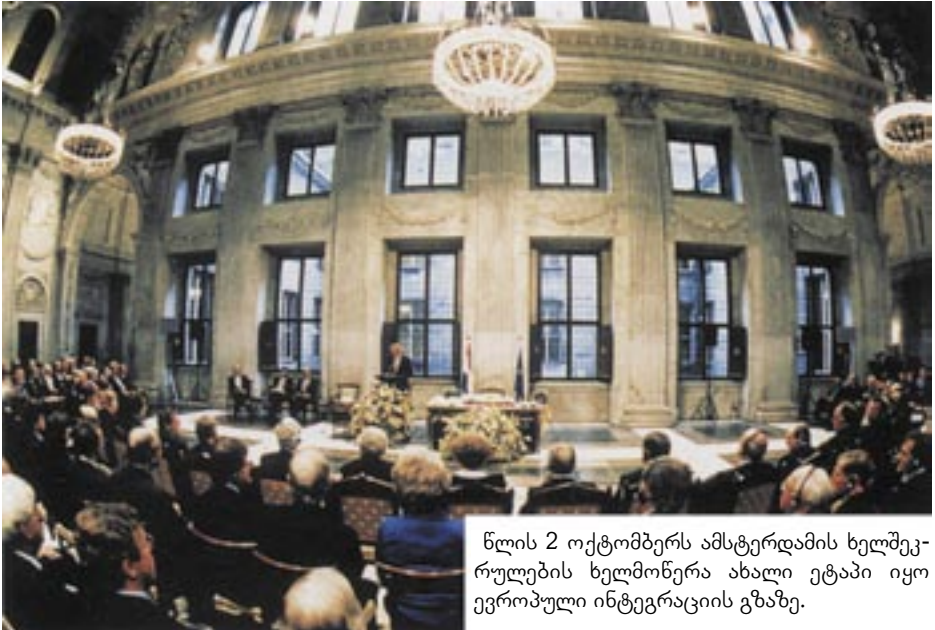
ნლის 2 ოქტომბერს ამსტერდამის ხელშეკრულების ხელმოწერა ახალი ეტაპი იყო ევროპული ინტეგრაციის გზაზე.

იტეტულ სფეროს: დახმარების მიმღები ქვეყნების მიერ წარმოებული საქონლის-თვის დონორი ქვეყნების ბაზრების ხელმისაწვდომობას; სოფლის მეურნეობას და საკვების წარმოებას; ინვესტირების ხელშეწყობას; პროფესიულ მომზადებას და გარემოს დაცვას.