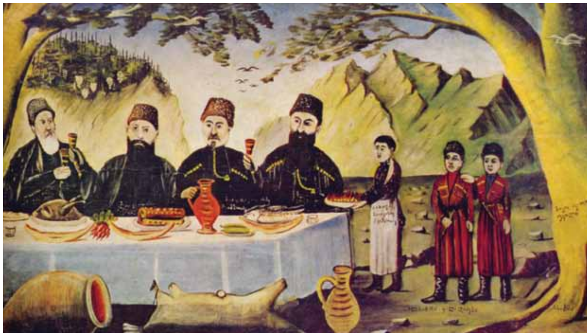
ქეიფი გვიმრაძესთან, მხატვარი – ნიკო ფიროსმანი