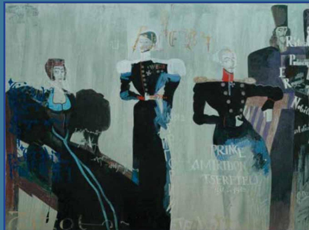
1832, სერიიდან „ქართული არისტოკრატია“. მხატვარი – ლევან ჭოლოშვილი