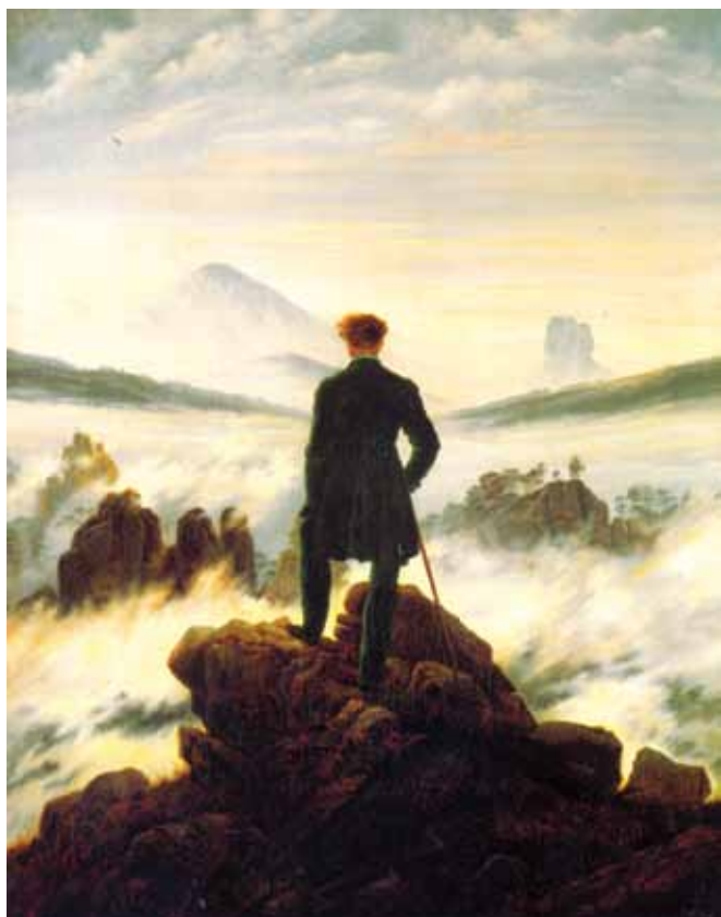
მოგზაური, მხატვარი – კ. დ. ფრიდრიხი

წარმოსახვაში არსებობს, მატერიაში ხორცშესხმისას აუცილებლად მახინჯდება. რომანტიკული იდეალის მოუხელთებლობის გამოხატულება იყო გერმანელ რომანტიკოსთა მიერ დამკვიდრებული უსაზღვროების კულტი. გახსნილი თვალსაწიერი, მარადიული მოძრაობა, მუდამ შორეთისაკენ მსწრაფი ჰორიზონტი რომანტიკოსთა შემოქმედებაში ორგანულად არის დაკავშირებული ავტორთა ოცნებასთან, მიუახლოვდნენ და შეერწყან იდუმალებით მოცულ უსაზღვროებას. უსაზღვროების კულტის გამოხატულება იყო ის, რომ გერმანელი რომანტიკოსი მხატვარი კასპარ დავიდ ფრიდრიხი პეიზაჟებს ჰორიზონტების გარეშე ხატავდა, რის გამოც მნახველს ისეთი განცდა ეუფლებოდა, თითქოს მისი მზერა უსასრულობაში ინთქმებოდა. უსაზღვროებისკენ ლტოლვა ერთ-ერთი მთავარი მოტივია ნიკოლოზ ბარათაშვილის პოეზიაშიც.