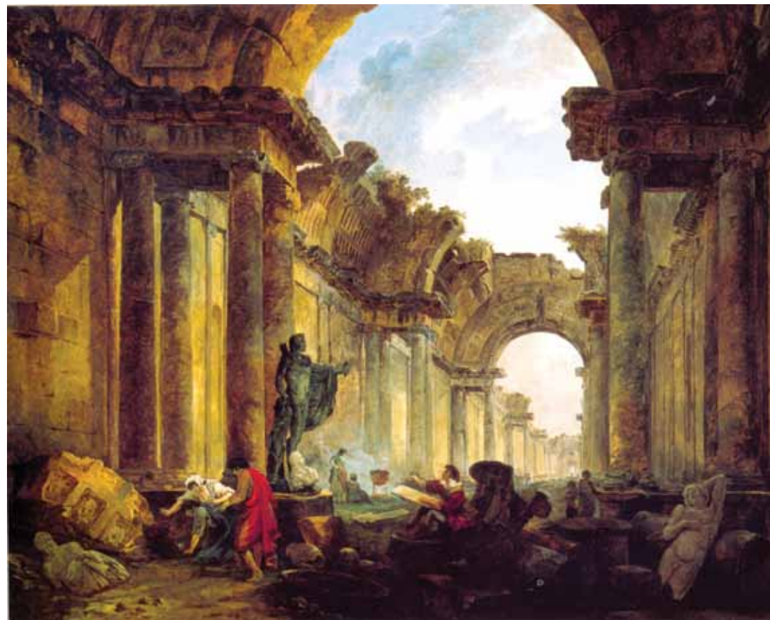
ლუკრის დანგრეული გალერიის წარმოსახვითი ხედი, მხატვარი – ჰ. რობერი

გამოდგება თუ არა ალექსანდრე ჭავჭავაძის „გოგჩა“ ამ თვალსაზრისის საილუსტრაციო მასალად?